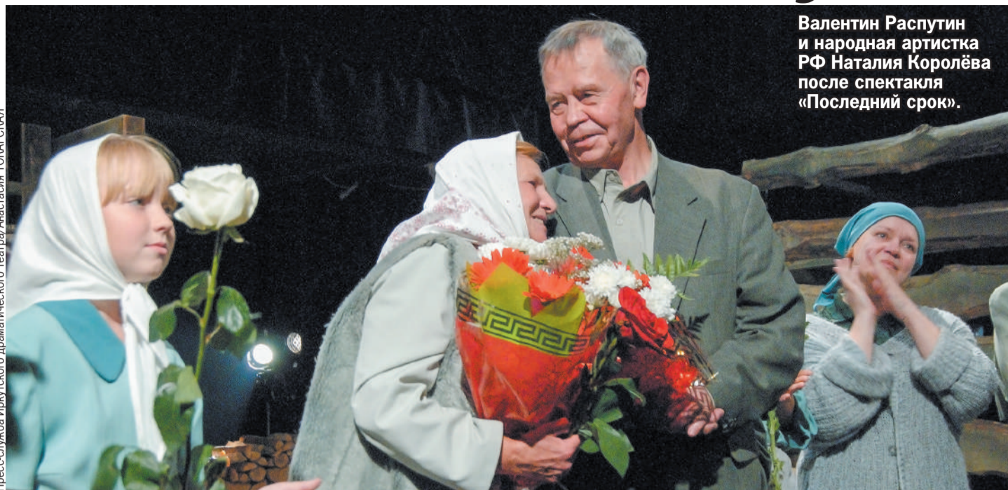
Валентин Распутин и народная артистка РФ Наталия Королёва после спектакля «Последний срок».

— Кузьма лежит на верхней полке в купе и смотрит в зеркало, — напо-