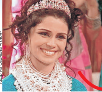
Кадр из сериала «Клон»

Антонелли весьма востребована в стране: помимо 40 проектов, в которых снялась актриса, в ее послужном списке и реклама, и ведение шоу на местном ТВ. Есть даже личный бизнес (под брендом Gio выпускает парфюмерию, сумки и стильные аксессуары). В популярной соцсети у Джованны более 20 млн подписчиков. Солидно!