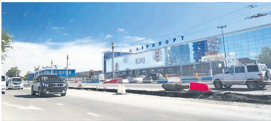
В этом году улицу, ведущую к аэропорту, продолжат ремонтировать.

В прошлом году в Октябрьском округе по нацпроекту «Инфраструктура для жизни» отремонтировали семь участков автомобильных дорог общей протяженностью более 10 километров. Кстати, в этом году продолжатся работы на улицах Байкальской и Ширямова.