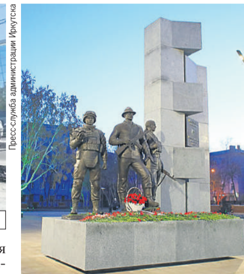
На площади Декабристов установили скульптуру, посвященную защитникам Отечества.