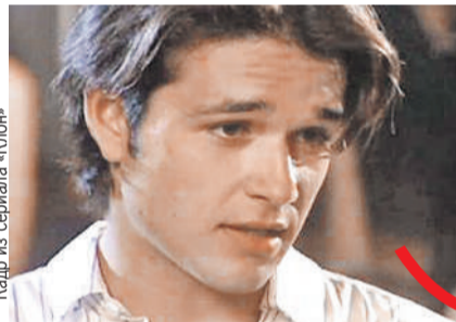
Кадр из сериала «Клон»