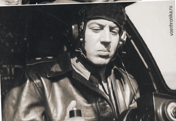
На счету Василия Сталина пять сбитых немецких самолетов, всего у летчика-истребителя пять боевых орденов.

- Документов, которые обосновывали «дискредитацию», в деле нет. Фактов превышения полномочий, рукоприкладства - тоже. Его убрали за мысли вслух. С 28 апреля, когда он был помещен под домашний арест в загородном доме, начали форми-