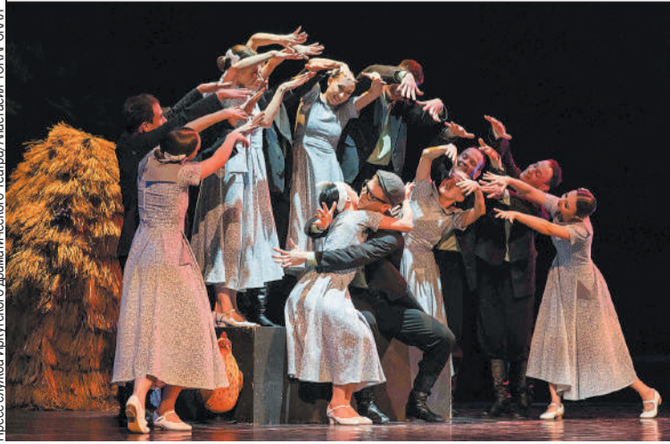
Сцена из спектакля «Край возле самого неба» Государственного молодежного ансамбля песни и танца «Алтай» имени А. Ф. Березикова, Барнаул.

— Есть задумка провести следующим летом большой театрально-литературно-поэтический форум. Хотелось бы привезти выдающихся поэтов, писателей, деятелей культуры и искусства нашего времени, — сказал директор.