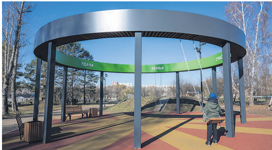
«Качели желаний» в Семейном парке.