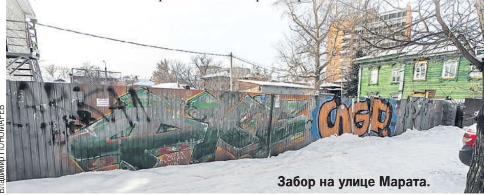
Забор на улице Марата.

- Действительно, сейчас при проведении капитального ремонта выбор цвета фасада - дело собственников. И мы видим, что порой возникают не совсем понятные колористические решения. Мы провели несколько совещаний и получили заверения, что отныне каждый фасад, который будет перекрашиваться в центральной части города (я думаю, в будущем это распространится и на другие районы), будет согласовываться с департаментом архитектуры и градостроительства и с будущим главным дизайнером города.