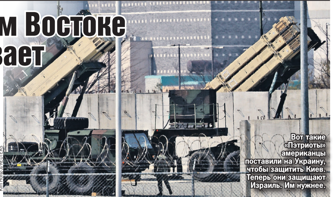
Вот такие «Пэтриоты» американцы поставили на Украину, чтобы защитить Киев. Теперь они защищают Израиль. Им нужнее.

Украина старалась не думать, для чего в конце ее уютной клетки есть дверца, которая всегда закрыта. Проще было верить, что миллиардные поставки вооружений Киеву происходят лишь от того, что политический украинец прекрасен и мил Западу сам по себе, просто потому что он есть. Любит свободу и демократию, ненавидит москалей, вот-вот их победит. Разве мало? Никто не сказал украинцам, что за тайной дверцей этой с поросят снимают шкурки и отрезают пятачки, когда стоимость корма превысит полезность их содержания.