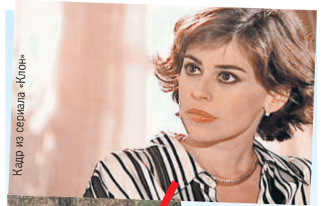
Кадр из сериала «Клон»

Пояснение для наших юных читателей. В центре сюжета - любовь марокканки Жади, воспитанной в строгих мусульманских традициях, и бразильца Лукаса из обеспеченной семьи; их чувствам мешают культурные различия и жизненные обстоятельства. После гибели Диогу - брата-близнеца Лукаса, ученый Альбиери в ходе смелого эксперимента создает его клон по имени Лео. Спустя годы судьбы Жади, Лукаса и Лео вновь переплетаются: замужняя Жади разрывается между долгом и чувствами, Лукас пытается вернуть утраченное, а Лео ищет собственное место в мире. В финале Жади остается с Лукасом, Лео вместе с Альбиери уходит в пустыню в поисках самоопределения, а другие герои находят пути к примирению и новой жизни.