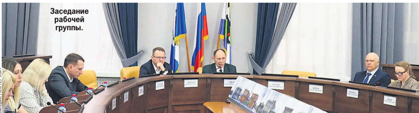
Заседание рабочей группы.