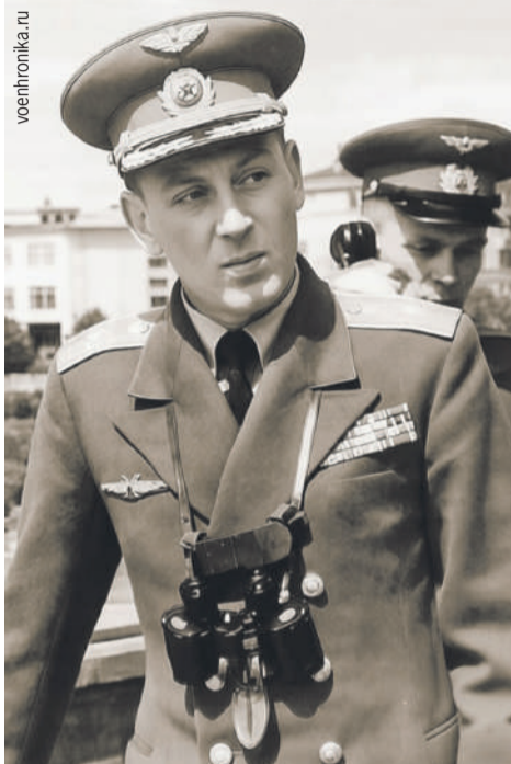
Генерал Василий Сталин почти пять лет командовал ВВС Московского военного округа.

Почему Сталину и сейчас ставят памятники, а не сносят их, читайте на нашем сайте