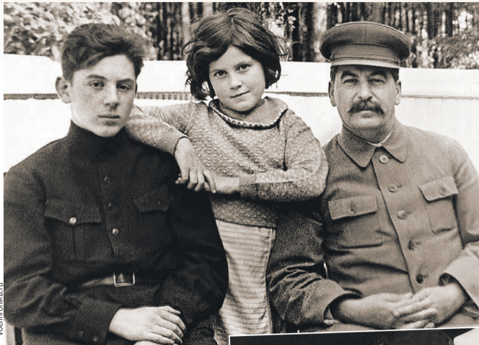
Редкий кадр: Иосиф Сталин чуть улыбается в усы, рядом с ним любимая дочь Светлана и вечный «непослушник» младший сын Василий.

- Версия, что Сталин-младший учился плохо, не совсем верна. Да,