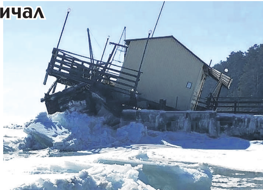
Предоставлено Алиной СТОМ

Самые важные новости, фото и видео - в телеграм-канале «КП» - Иркутск»