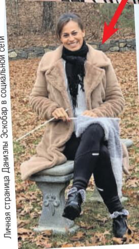
Личная страница Даниэлы Эскобар в социальной сети

Жену Лукаса и любовницу Саида - несчастную Маицу, сыграла Даниэла Эскобар. Тоже весьма популярная в Бразилии актриса, собравшая в фильмогра-