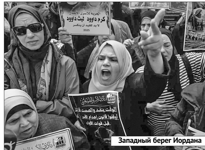
Западный берег Иордана

Законпроект бурно обсуждался в кнессете несколько месяцев, и 8 февраля 2026 года кнессет одобрил его во втором чтении 57 голосами против 14. Ещё тогда Управление тюрем Израиля взялось за подготовку к строительству спецкомплекса для исполнения казней. В то время негативная реакция мирового сообщества на одобрение ПУКСКТ продолжала нарастать. В Великобритании назвали принятие документа актом деградации, Еврокомиссия расценила его как нарушение принятых международных норм, а верховный комиссар ООН по правам человека убито, что речь идёт о военном преступлении. В отношении дискриминационного документа высказалась и Испания. «Это асимметри-