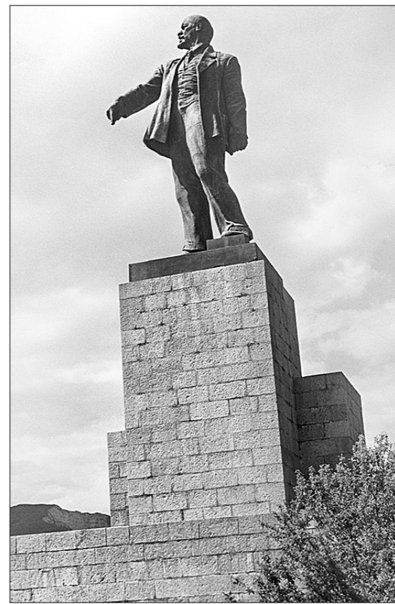
Памятник Ленину на ЗАЭС.