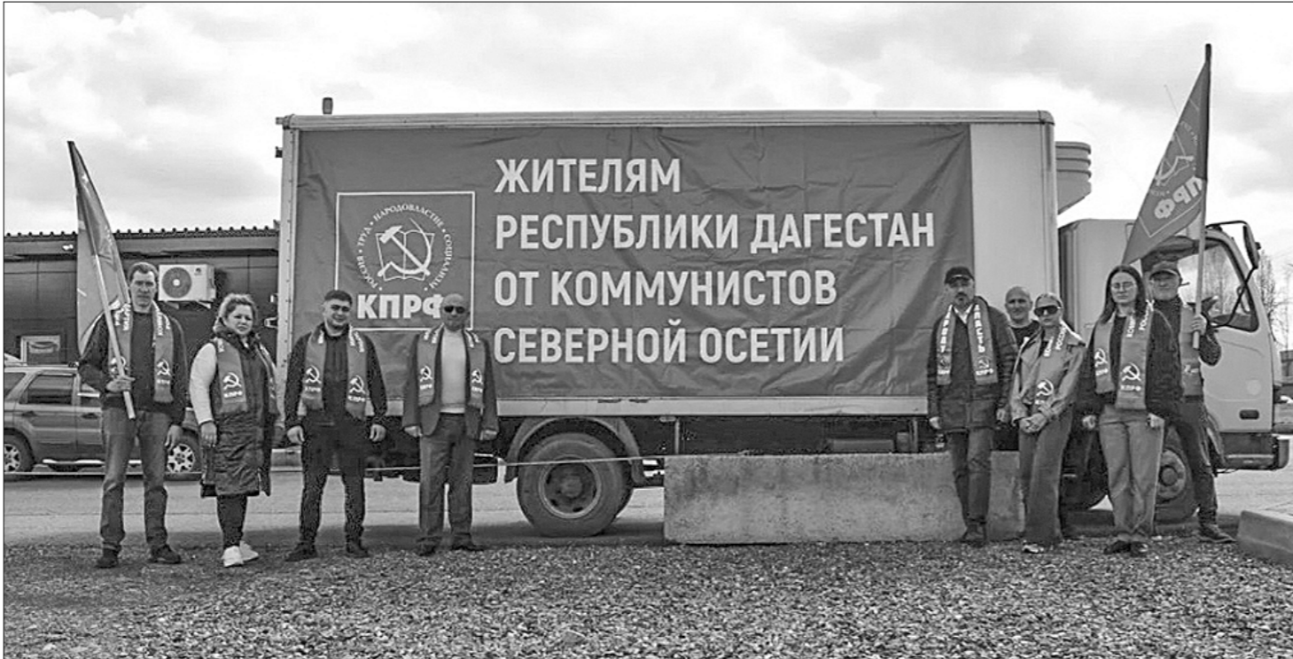
Отдел ЦК КПРФ по национальной политике и прес-служба Северо-Осетинского республиканского отделения КПРФ.