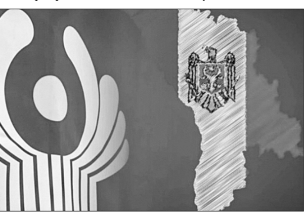
Сергей АДАМОВ.

Нынешний Евросоюз задыхается от милитаризации, антироссийских санкций, роста цен на продукты питания и топливного кризиса. Даже в