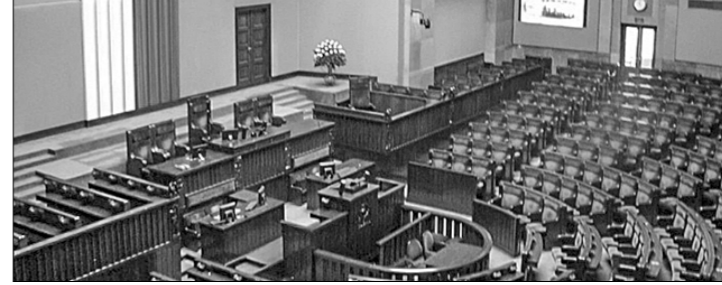
«Я не сомневаюсь, что разница на выборах будет незначительной, — выразил своё мнение политолог Рафал Хведорук в интервью сайту Onet.pl. — Как общество мы очень разделены. Вот почему эти различия в опросах поддержки, как правило, настолько малы», — пояснил он. Эксперт считает, что на предстоящих выборах наиболее важными будут не результаты основных партий, а результаты оппозиции.

«Я не сомневаюсь, что разница на выборах будет незначительной, — выразил своё мнение политолог Рафал Хведорук в интервью сайту Onet.pl. — Как общество мы очень разделены. Вот почему эти различия в опросах поддержки, как правило, настолько малы», — пояснил он. Эксперт считает, что на предстоящих выборах наиболее важными будут не результаты основных партий, а результаты оппозиции. «Общественно, что разочарованный электорат основных игроков переходит на сторону более мелких партий. Зачастую это зависит от различных решений, принимаемых именно этими партиями».