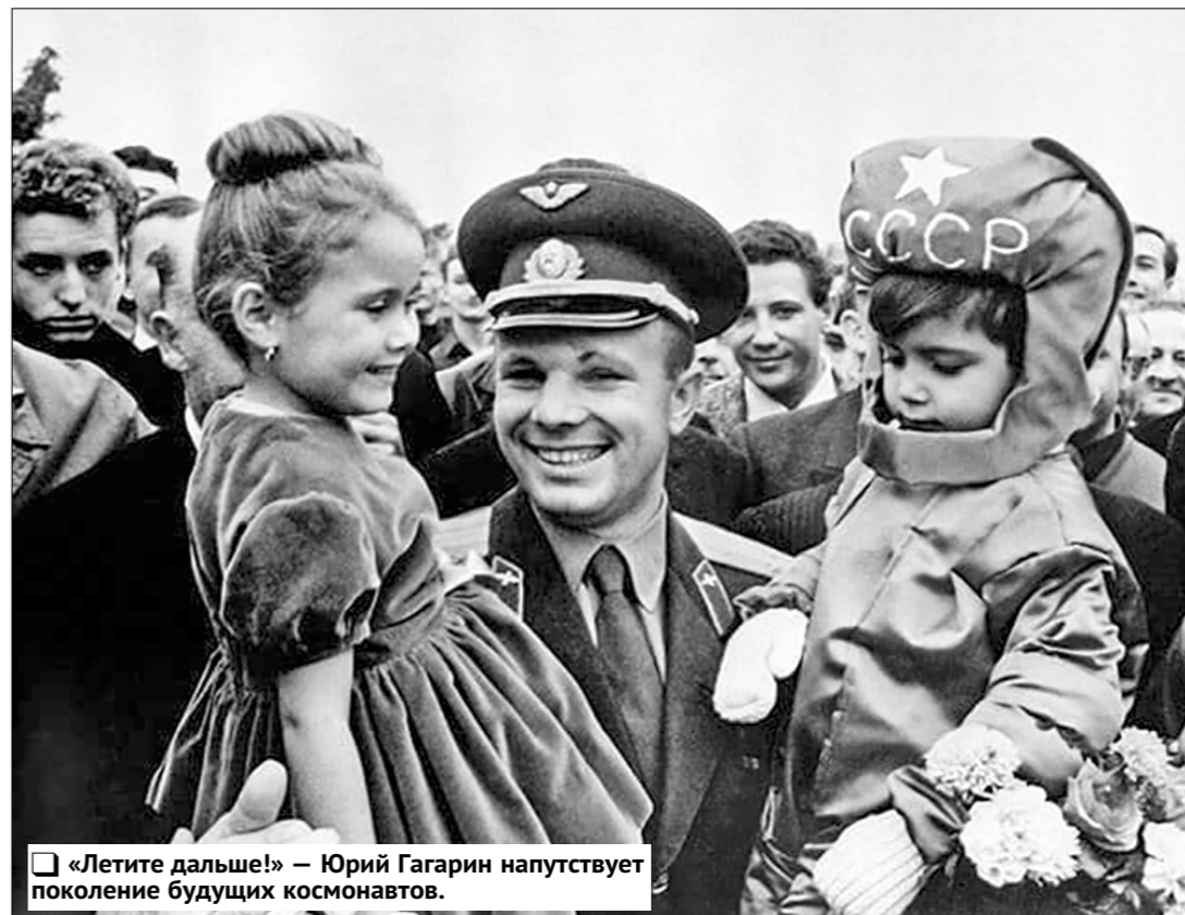
«Летите дальше!» — Юрий Гагарин напутствует поколение будущих космонавтов.

Если веки развития человечества размещать по значимости, то 12 апреля 1961 года встанет в этом ряду особенно близко к главной из них — Великому Октябрю 1917 года. Без социалистической революции свершённый в тот весенний день гагаринский старт, открывавший землянам просторы Вселенной, был бы решительно невозможен.