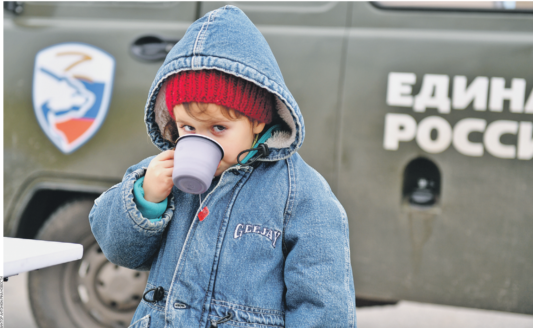
Вчера 13:03 Юная беженка с украинских территорий согревается горячим чаем на территории многостороннего автомобильного пункта пропуска «Шебекино» в Белгородской области. За последние сутки в регионе разместили более 1300 беженцев, которые в основном эвакуируются из Харьковской области

За трое суток, по данным Минобороны РФ, уничтожено более двух тысяч украинских и иностранных боевиков, а также свыше 100 единиц бронетехники и артиллерии. — Все эти города будут возвращены обратно, там уже находятся наши люди, специально подготовленные для этой