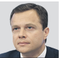
МАКСИМ ЛИКСУТОВ ЗАМЕСТИТЕЛЬ МЭРА МОСКВЫ, РУКОВОДИТЕЛЬ ДЕПАРТАМЕНТА ТРАНСПОРТА И РАЗВИТИЯ ДОРОЖНО-ТРАНСПОРТНОЙ ИНФРАСТРУКТУРЫ

2021 года — тогда было 6,84 миллиона поездок в день — рост составляет 5 процентов. А на наземном транспорте в рабочий день совершается 3,72 миллиона поездок. Для сравнения летом было 3,32 миллиона. Пассажиропоток растет, а мы продолжаем развивать московский транспорт. Ведется подготовка к запуску Большой кольцевой линии (БКЛ) метро. С полным вводом БКЛ изменится транспортная ситуация во всем городе: на радиальных линиях метро станет свободнее до 22 процентов, на Кольцевой — до 25 процентов, вылетные магистрали разгрузятся в среднем на 5 процентов, Третье транспортное кольцо — до 10 процентов. Экономия времени в пути составит до 45 минут в сутки. Линия полностью заработает для пассажиров в следующем году. Ее запуск даст городу суммарно больше 6 тысяч новых рабочих мест — это ощутимая поддержка рынка труда в нынешних условиях. Добавлю, что почти на 90 процентов готово новое электродепо «Нижегородское» для обслуживания поездов Большой кольцевой линии метро.