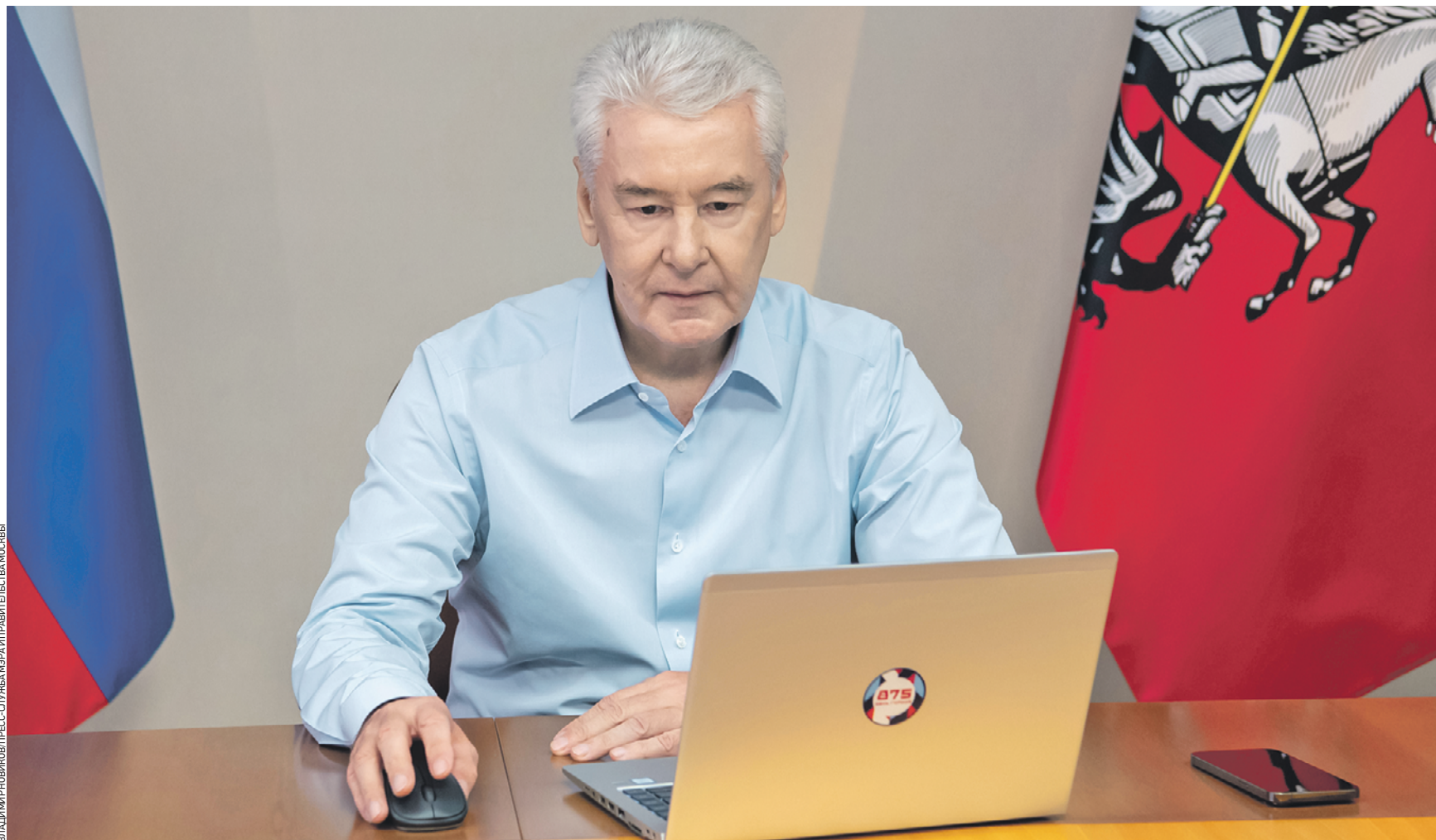
Вчера 14:05 Мэр Москвы Сергей Собянин голосует дистанционно на выборах депутатов муниципальных образований столицы. Он использовал именно электронный способ голосования, потому что это быстро, удобно и надежно