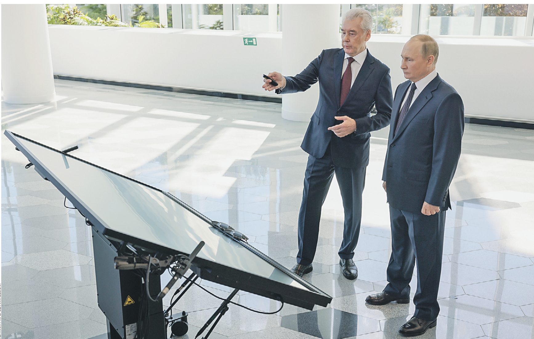
10 сентября 13:45 Президент России Владимир Путин (справа) и мэр Москвы Сергей Собянин в день рождения столицы в концертном зале «Зарядье» запускают по видеосвязи движение на участке Московского скоростного диаметра. В этот же день они открыли колесо обозрения «Солнце Москвы» на ВДНХ

Главные поздравления в честь юбилея Москвы прозвучали на праздничном концерте в «Зарядье». — Мы гордимся Москвой, любим этот город с его величавой стариной и современным, динамичным, стремительным ритмом жизни, с очарованием уютных парков, переулков и улиц и с насыщенностью деловых и культурных событий, — сказал Владимир Путин. Президент отметил, что Москва по праву считается одним из самых красивых и комфортабельных мегаполисов мира.