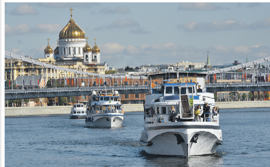
10 сентября 10:46 Теплоходы с пассажирами на борту плывут по Москве-реке во время ежегодного парада судов в День города

Мероприятия, посвященные Дню города, проходили по всей столице. Одной из главных площадок стала Тверская улица, где в праздничные дни собирается больше всего москвичей и гостей города. Соответственно, здесь сконцентрировано все самое яркое и интересное.